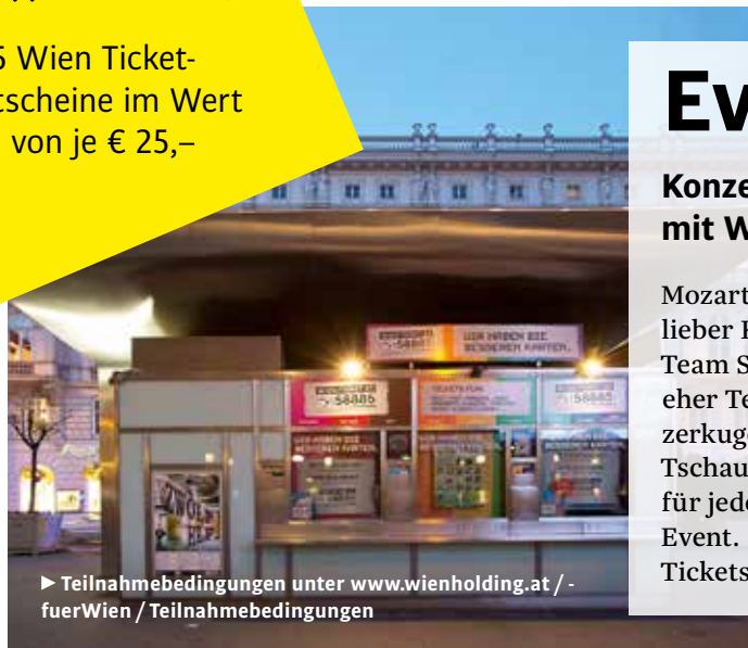
► Teilnahmebedingungen unter www.wienholding.at / - fuerWien / Teilnahmebedingungen